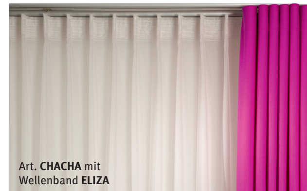
Art. CHACHA mit Wellenband ELIZA

DIE QUAL DER WAHL - Verdeckte oder sichtbare Vorhangschiene? Mit den Multitaschenbändern von BAND-DEX ist beides möglich!